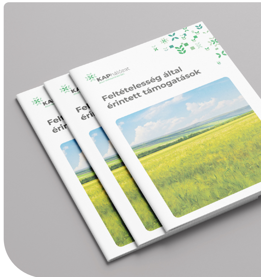
2. ábra – Feltételeesség által érintett támogatások kiadvány

Feltételeesség által érintett támogatások