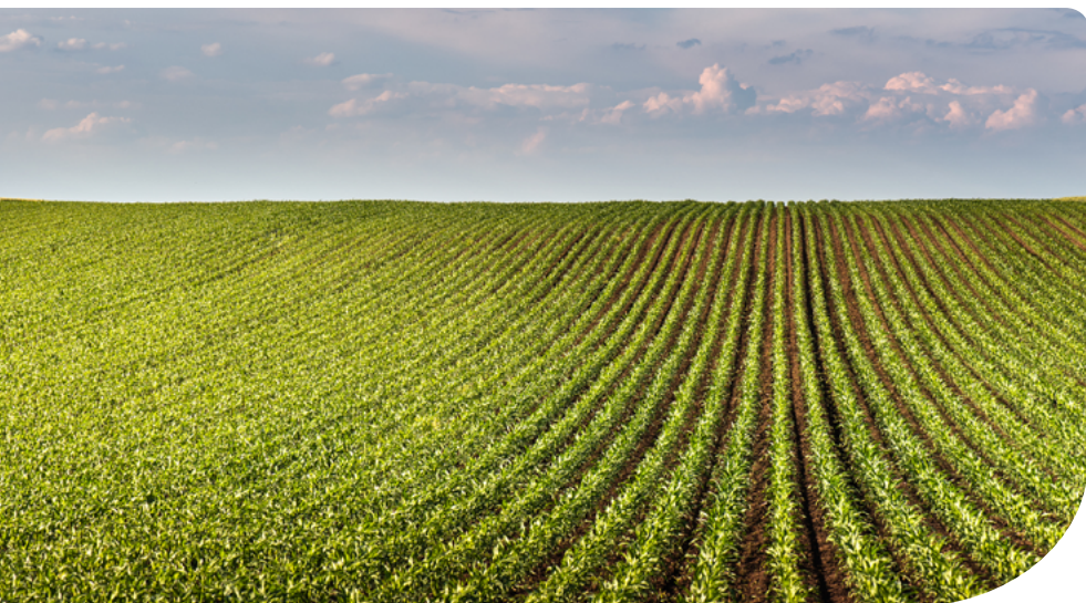
9. ábra – 12%-nál nagyobb lejtésű területen kukorica rétegvonalakkal merőleges (lejtővel párhuzamos) termesztése tilos!

Erózióvédelmi sáv kerül kialakításra lágy vagy fás szárú növények által 3-20 méteres szélességgel a szintvonalakkal közel párhuzamosan, átlagosan 100 méteres távolságra. Helyszínen kerül ellenőrzésre a gazdálkodói rajz alapján. A helyszíni mérés az irányadó, a kézi rajz alapján az elvárt szélességek nem kerülnek ellenőrzésre.