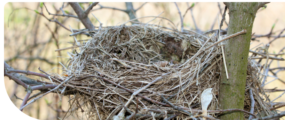
16. ábra – Madárfészek

Ami ellenőrzésre kerül: a március 1. és augusztus 31. közötti időszakban történt-e fakivágás, metszés vagy csonkítás. A magányosan álló fák esetében pedig az egész év során történt-e fakivágás, metszés vagy csonkítás.