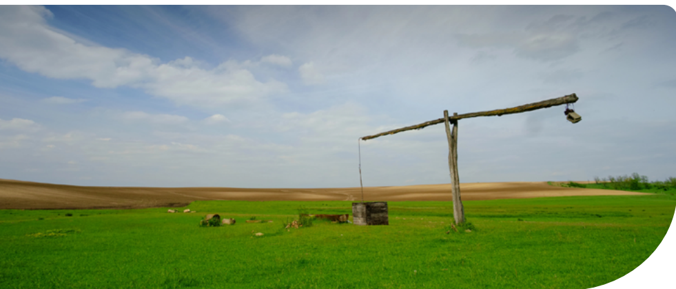
11. ábra – Gémeskút

Ami ellenőrzésre kerül: az ellenőrzés során a fentiek betartását vizsgálják. Az ellenőrzés alapja a 2010. évben létrehozott gémeskút adatbázis.