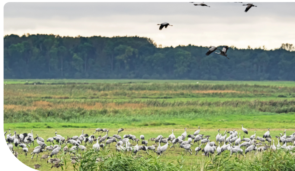
5. ábra – Vizes élőhely

Amennyiben 2025. március 28. előtt (azaz a végleges MePAR fedvény megismerése előtt) a fenti előírások megsértése nem jár szankcióval.