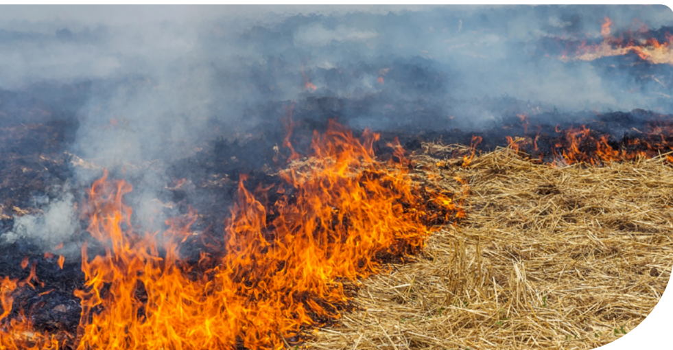
6. ábra – Tarló égetés

A helyszíni vizsgálaton jelen lévő mezőgazdasági termelő legkésőbb a támogatás igénybevételéhez kapcsolódó JFGK és HMKÁ előírások betartásával összefüggő helyszíni vizsgálat során jelezheti, ha a gazdasága vis maiorral érintett, továbbá kérheti az ellenőrzés során az azt megelőzően a gazdaságával összefüggésben bejelentett vis maior eset figyelembevételét. Ha a helyszíni vizsgálaton sem a mezőgazdasági termelő, sem a képviselője nem volt jelen, a mezőgazdasági termelő legkésőbb a részére megküldött ellenőrzési jegyzőkönyv észrevételezése során jelezheti, hogy gazdasága vis maiorral érintett, továbbá kérheti az ellenőrzést megelőzően a gazdaságával összefüggésben bejelentett vis maior eset figyelembevételét.