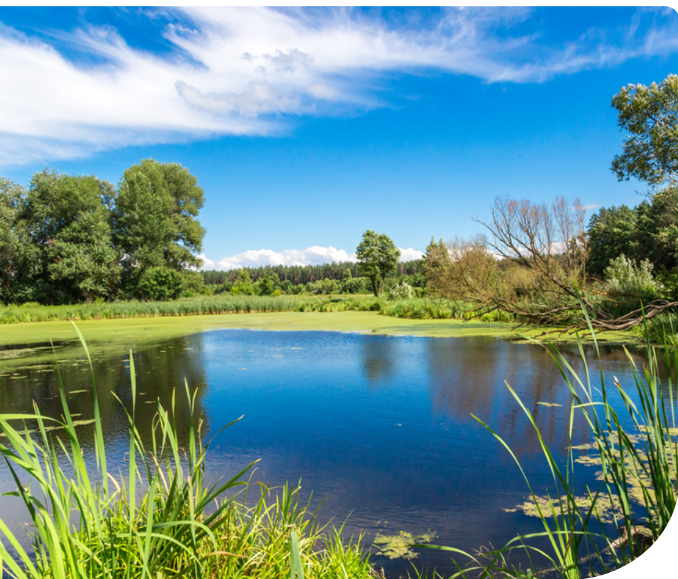
15. ábra – Kis kiterjedésű tó

Ami ellenőrzésre kerül: a helyszínen összehasonlításra kerül az adott kis kiterjedésű tó fedvény általi területe a valós területtel. Az előírás megsértését jelenti a tó egészének vagy egy részének feltöltése, beművelése, rajta burkolt aljzattal rendelkező víztározó kialakítása, illetve egyéb mesterséges módon történő állapotrontása. A vízfelület szárazabb időszak miatti természetes csökkenése vagy a nádas terjedése nem eredményez szankciót.