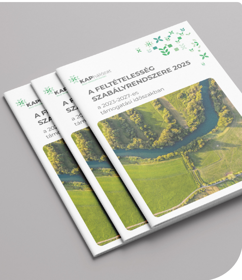
3. ábra – Feltételesség szabályrendszere 2025

A FELTÉTELESSÉG SZABÁLYRENDSZERE 2025 a 2023-2027-es támogatási időszakban A Helyes Mezőgazdasági és Környezeti Állapot fenntartására vonatkozó gyakorlatok (HMKÁ)