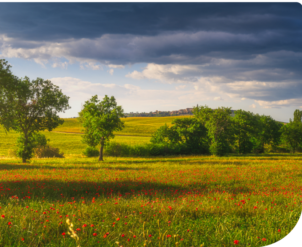
13. ábra – Fa-, és bokorcsoport

Ami ellenőrzésre kerül: a helyszínen összehasonlításra kerül az adott fa- és bokorcsoport fedvény általi területe a valós területtel. Azaz a fa- és bokorcsoport valós területe nem lehet ettől kisebb. Fa- és bokorcsoport területén talajmunka végzése tilos. Ez alól kivételt képez a visszafásítás vagy a gyeperősítés helyreállítása érdekében történő előkészítő munkálatok.