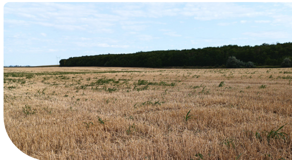
10. ábra – Tarló megőrzése

Ami ellenőrzésre kerül: a helyszínen megvizsgálásra kerül a fentiek betartása a terület többszöri felkeresésével. Az ellenőrzés különösen arra vonatkozik, hogy 30 napnál tovább ne legyen fedetlen a terület az érzékeny időszakban, vonatkozik ez a PIH01 területekre is. A másodvetés összetételére