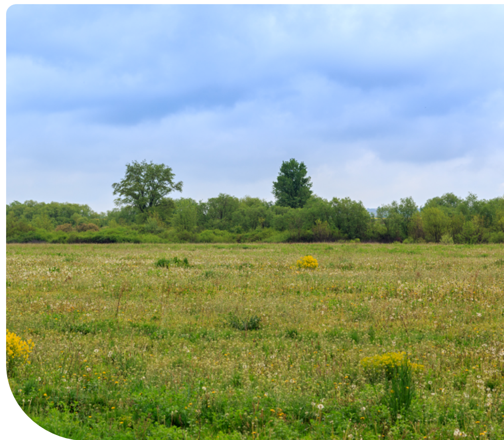
4. ábra – Állandó gyepterület

Ha a mezőgazdasági termelő a tárgyévet megelőző évben bejelentett és elismert elháríthatatlan külső ok (a továbbiakban: vis maior) miatt nem teljesítette a visszaállítási kötelezettségét, úgy a tárgyévben köteles ennek eleget tenni, továbbá a tárgyévi egységes kérelemben állandó gyepterületként bejelentett földterületei tekintetében további olyan vis maior bejelentés nem fogadható el, amelyben a visszaállítási kötelezettség alóli mentesítést kezdeményezi.