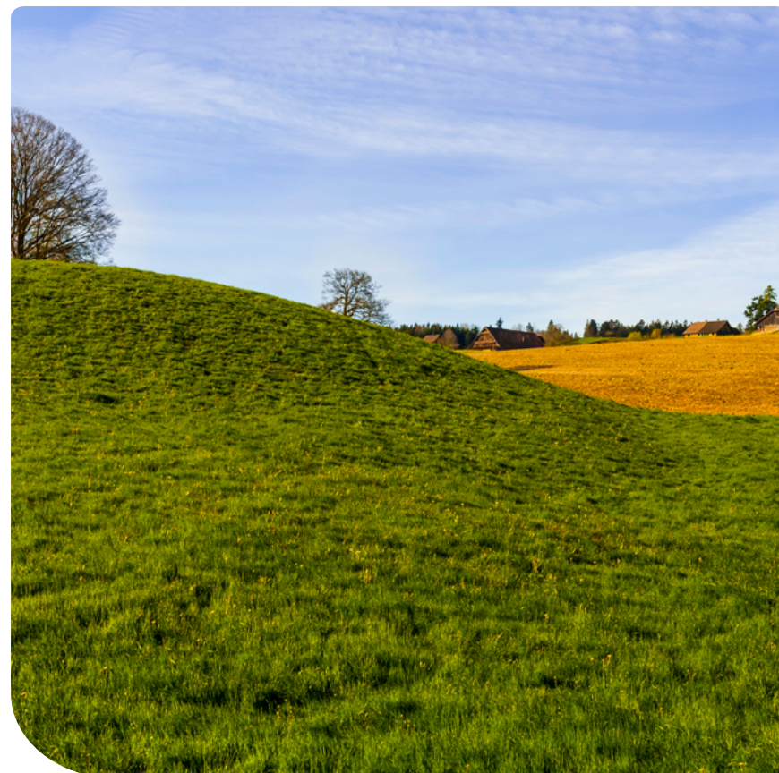
12. ábra – Kunhalom

Ami ellenőrzésre kerül: a helyszínen összehasonlításra kerül az adott kunhalom fedvény általi területe a valós területtel. Azaz a kunhalom valós területe nem lehet ettől kisebb. Továbbá a kunhalom teljes területén tilos a talajmunkák végzése, kivéve, ha ez a visszagyepesítést szolgálja.