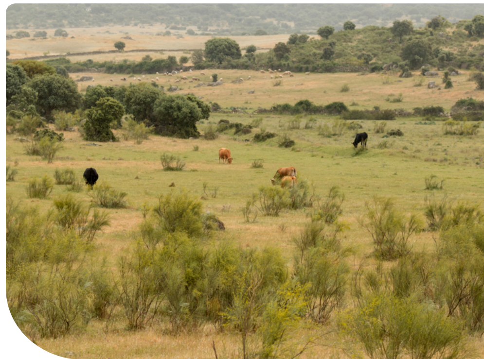
18. ábra – Natura2000 gyepterület

Általánosságban a szándékosság gyanúja akkor vetődhet fel, ha a gazdálkodó, vagy képviselője tudatában van annak, hogy a tanúsított tevételes magatartás vagy mulasztás a támogatásokkal összefüggésben a támogatási jogosultság jogosulatlan megszerzése, annak fenntartása, illetve a támogatásokkal összefüggésben jogosultságának bármely eleme vonatkozásában kedvezőbb elbírálást biztosít, mint a tanúsított tevételes magatartás vagy mulasztás nélkül.