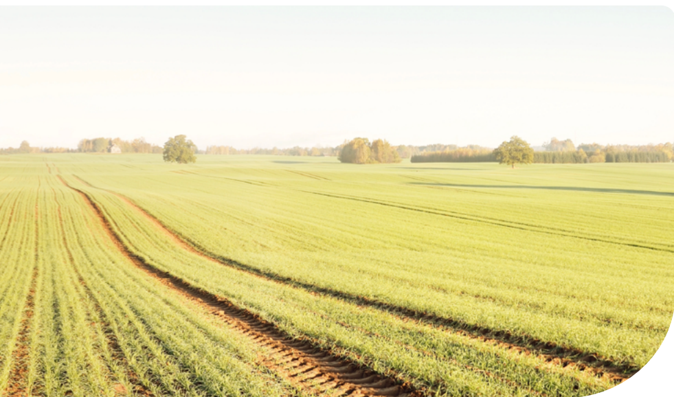
1. ábra – Szántóföld

A Feltételesség részét képező HMKÁ nem egy konkrét jogcím vagy intézkedés, azonban az előírásait a támogatások teljeskörű elérése érdekében minden gazdálkodónak be kell tartani a gazdaság teljes területén, beleértve a támogatást nem igényelt területeket is (pl. 0,25 ha alatti).