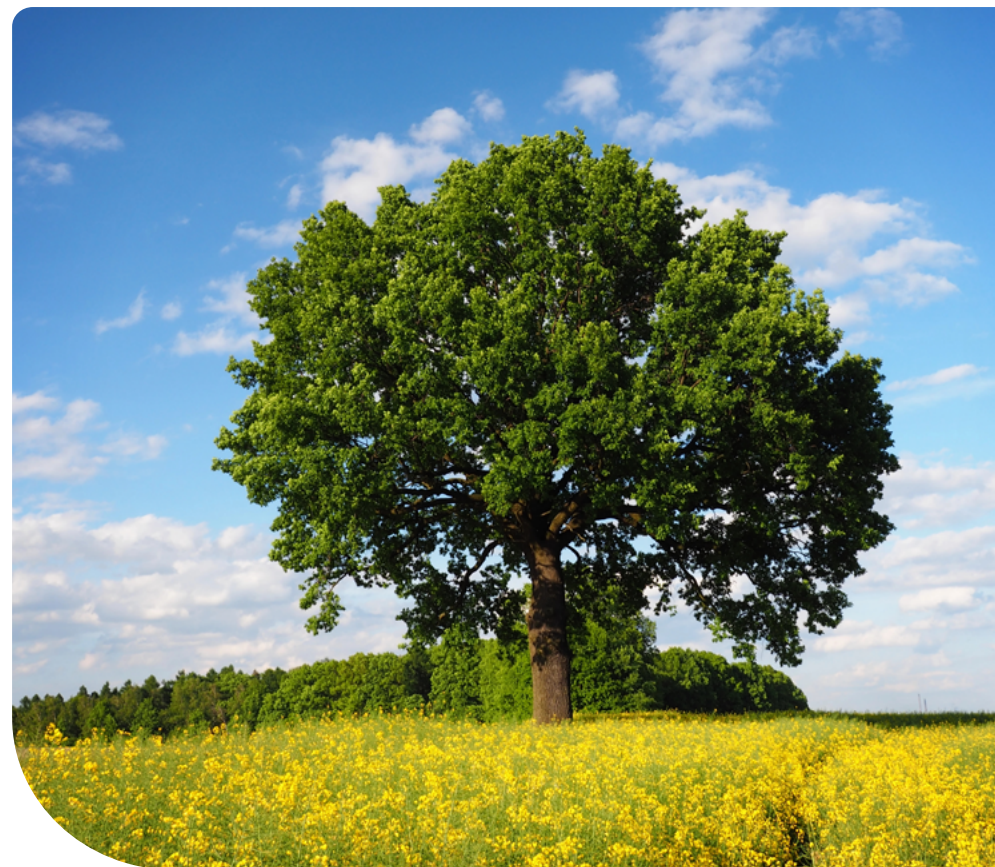
14. ábra – Magányosan álló fa