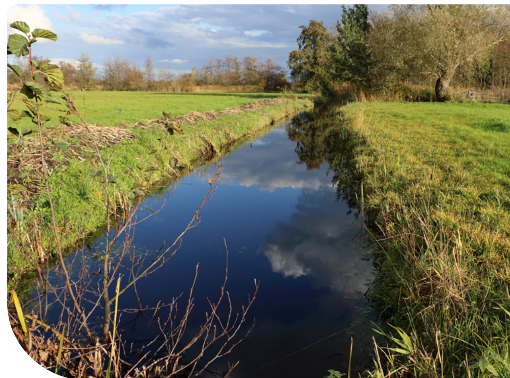
7. ábra – Vízfolyás menti védelmi sáv