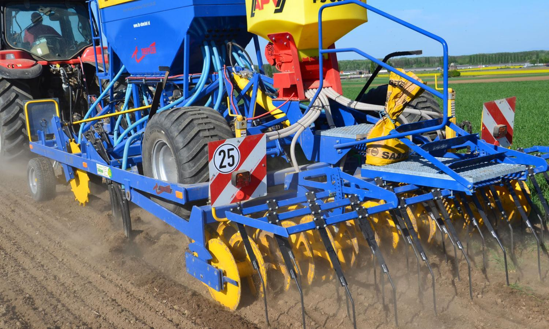
Doppelringpackerwalze mit Kurbelverstellung, 3-reihiger Striegel