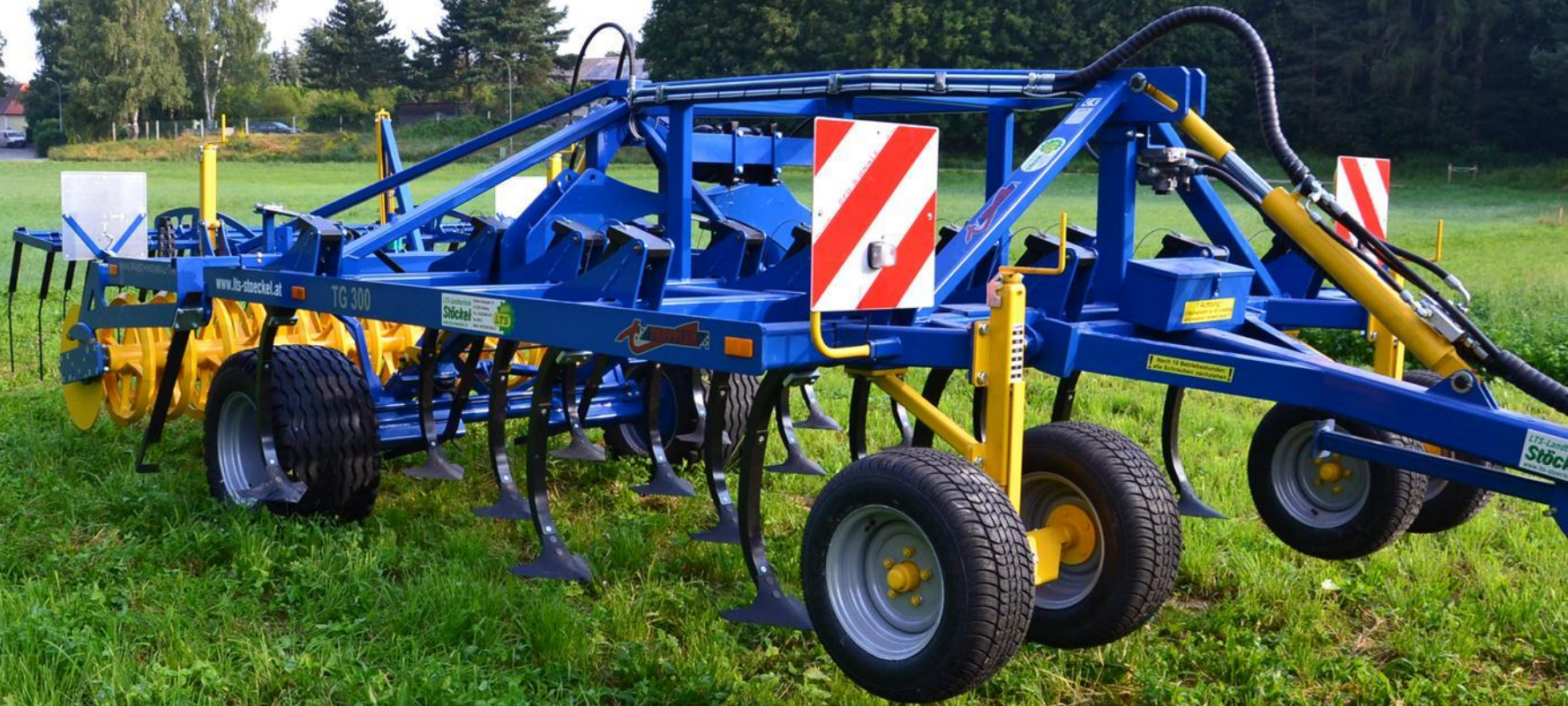
Pendelstützräder mit Kurbelverstellung, Arbeitsmarkierung, Warntafeln