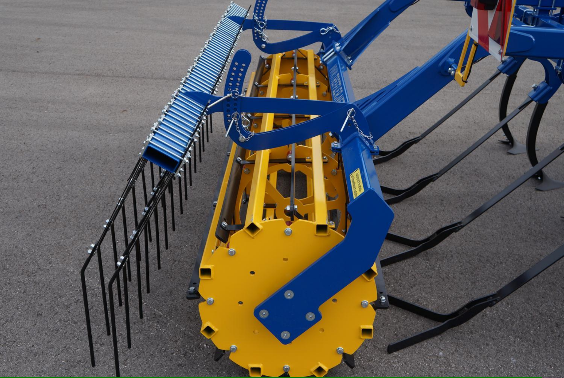
Doppelter Blattfederstriegel, patentierte Federleistenwalze Dm=600mm