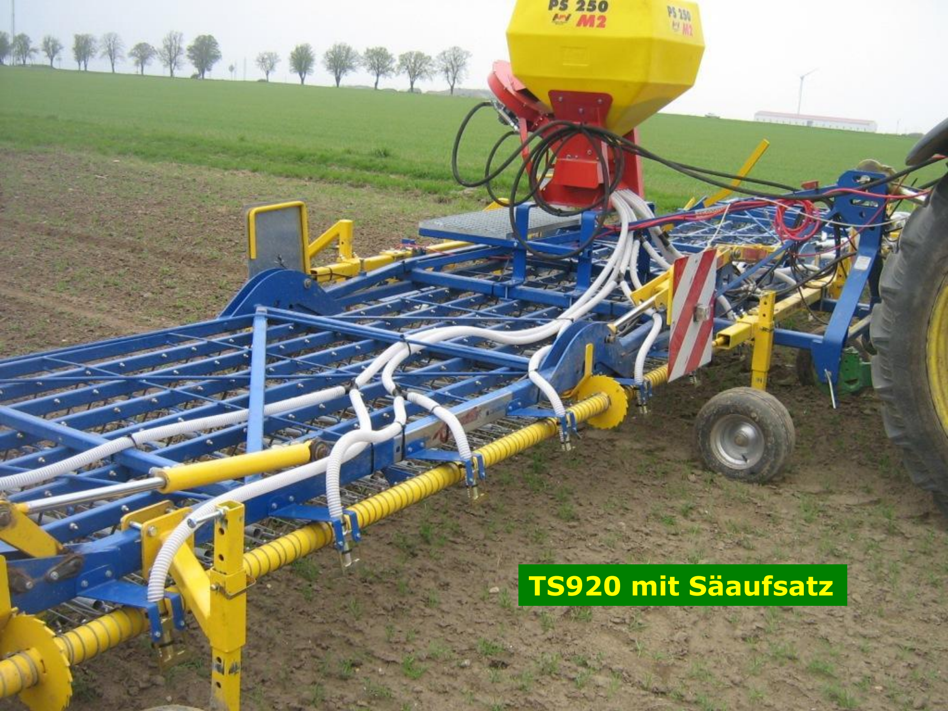
TS920 mit Säufsatz